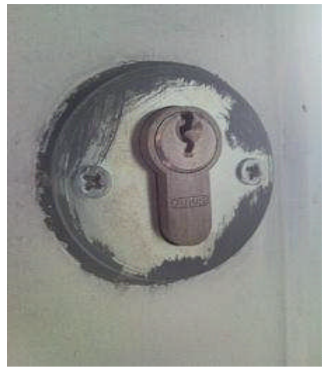
falsch: Zwar ein Sicherheitsschloss, aber die Blende ist abschraubbar