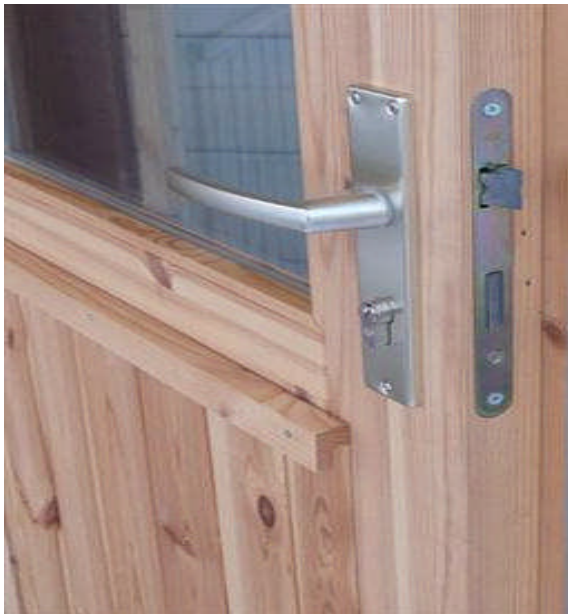
falsch: Zwar Sicherheitsschloss, aber Schließzylinder steht über und Blende ist abschraubbar