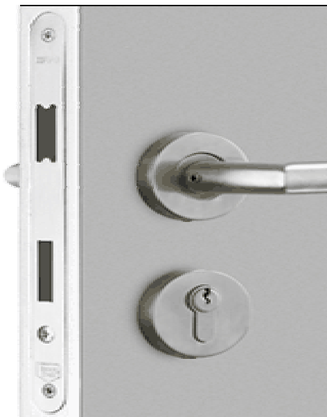
richtig: Sicherheitsschloss / bündige Blende und Blende ist nicht abschraubbar